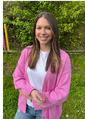
Pädagogische Fachkraft Qualifizierte Kinderschutzbeauftragte als IseF